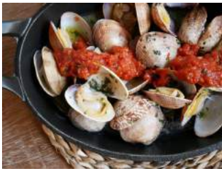
Gats, el bar de barrio 2.0 26 Julio, 2016