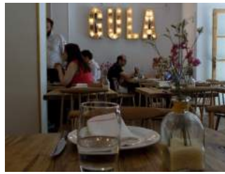
Santa Gula, para pecar sin parar 13 Junio, 2016