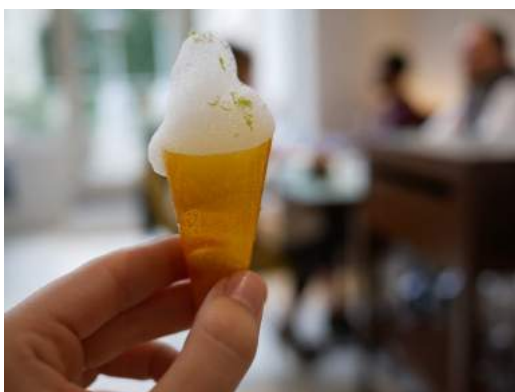
Cornete de mango y curry