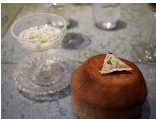
Cóctel de coco thai i candy de cacahuete

Qué comer: si miráis en su web hay 5 menús disponibles, todos ellos oscilan entre los 20-30 platos. Así que nadie mejor que el personal de sala os podrá aconsejar el menú que más os convenga. Nosotros nos decantamos por el gran festival, y aquí están los platos que comimos. Aprovechamos para deciros, que si sois alérgicos a alguno de los platos del menú, os lo cambiarán sin problema.