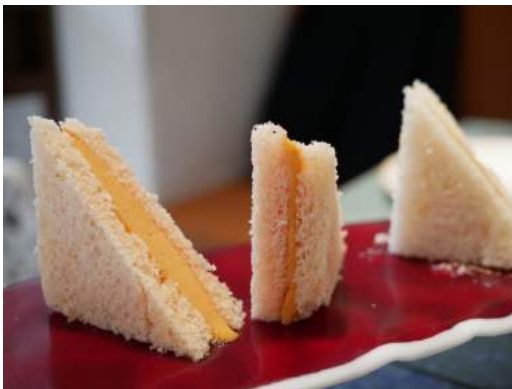
Sandwich de gazpacho con guarnición olorosa de vinagre