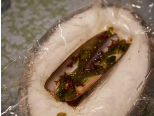
Conserva de navaja y algas a la sal