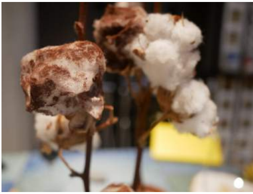
Algodón de cacao y menta