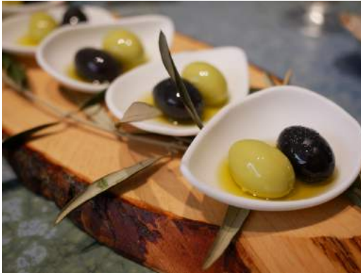
Las olivas de Disfrutar con esencia de flor de mandarinero