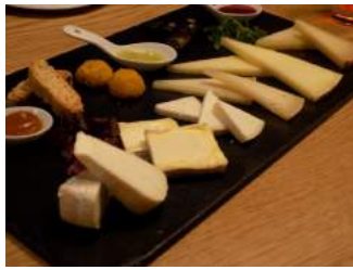
Cheeso, más allá del queso 1 Agosto, 2016