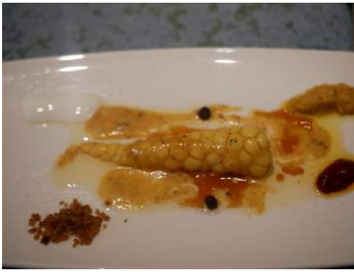
Panocha de maíz multi esférica