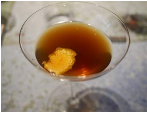
Consomé de liebre a la naranja rustida