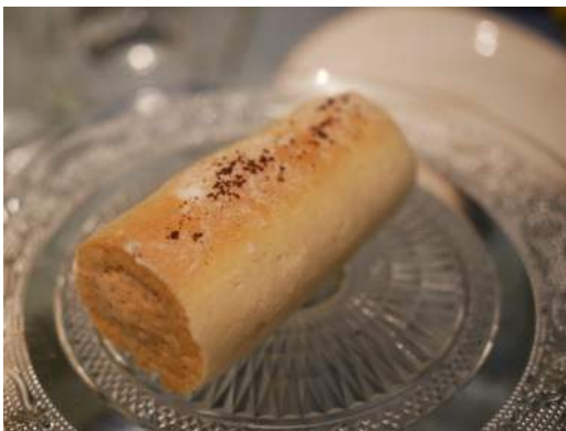
Brazo de gitano de café