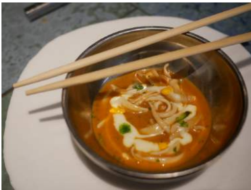
Noodles de espardeñas