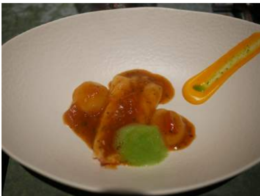
Suquet de langostino