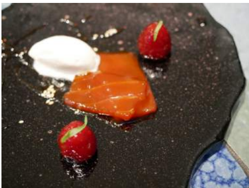
Atún con frambuesas marinadas y sake-kasu