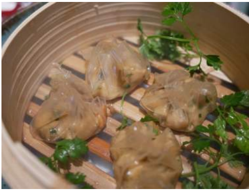
Dumplings de ceps