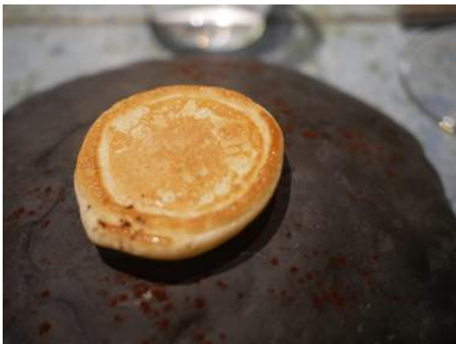
Blini de liebre