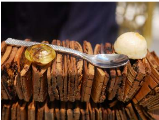
Tarta al Whisky