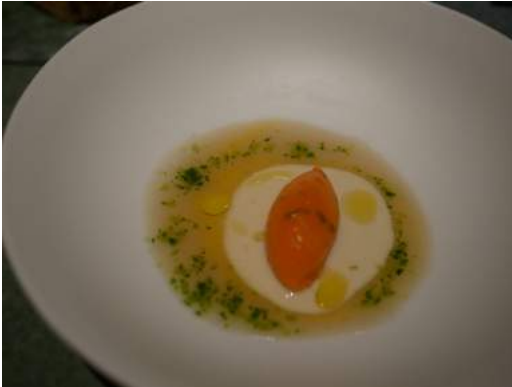
Ceviche en deconstrucción