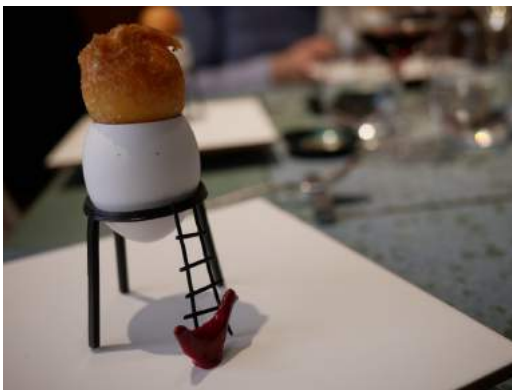
Yema de huevo crujiente con gelatina de setas