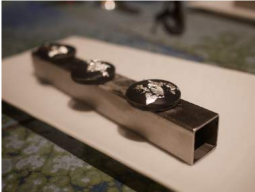
Bombón de foie-gras