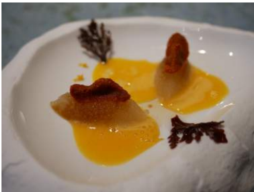
Sémola de dashi con erizo de mar