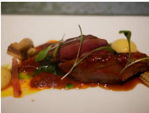
Pichón a la marroquí