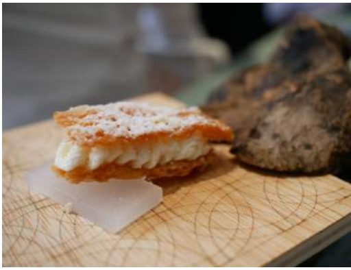
Milhojas de Idiazábal con zumo de manzana