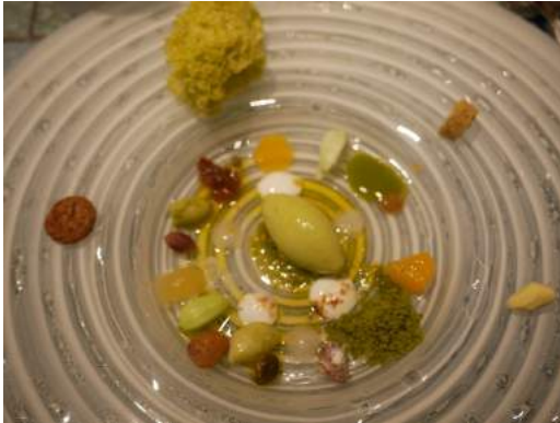
Elaboraciones con Pistacho