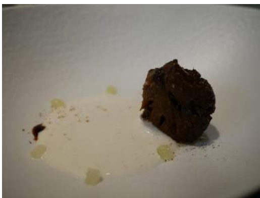
Coliflor negra con bechamel de coco y lima