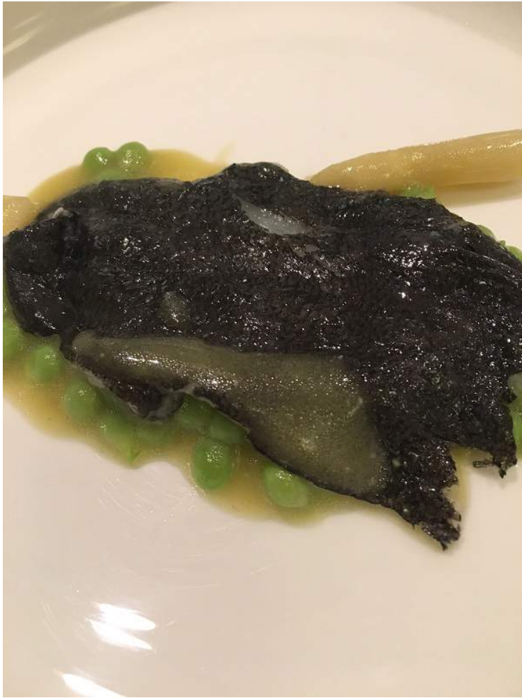
8 YEMAS. ORICIO, HUEVO Y TRIGUEROS. Casa Gerardo