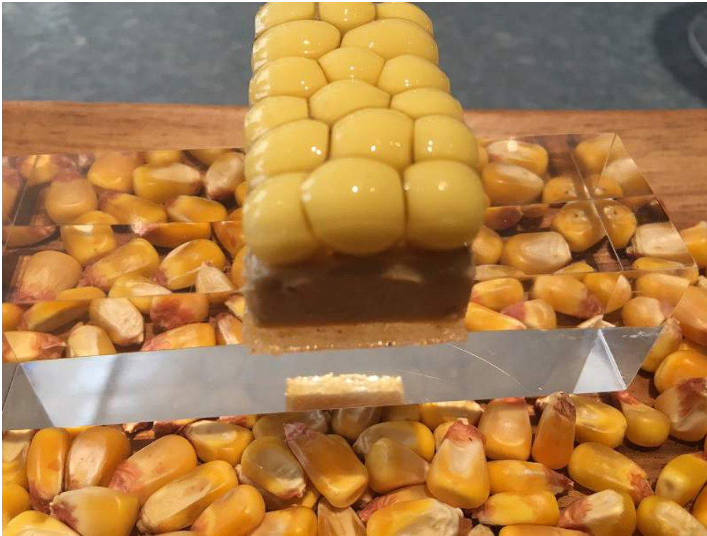
Tatin multiesférica de foie gras y maíz

3 SECUENCIA DEL PICHÓN: TATIN MULTIESFÉRICA DE FOIE GRAS Y MAÍZ; PICHÓN CON ABRIGO DE MAÍZ; BOMBÓN DE PICHÓN Y FOIE GRAS. Disfrutar