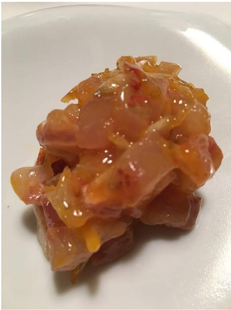
6 ESCABECHE DE FAISANA EN BARRICA DE OLOSOSO CON MANGO ENCURTIDO Y FOIE DE PATO. Coque