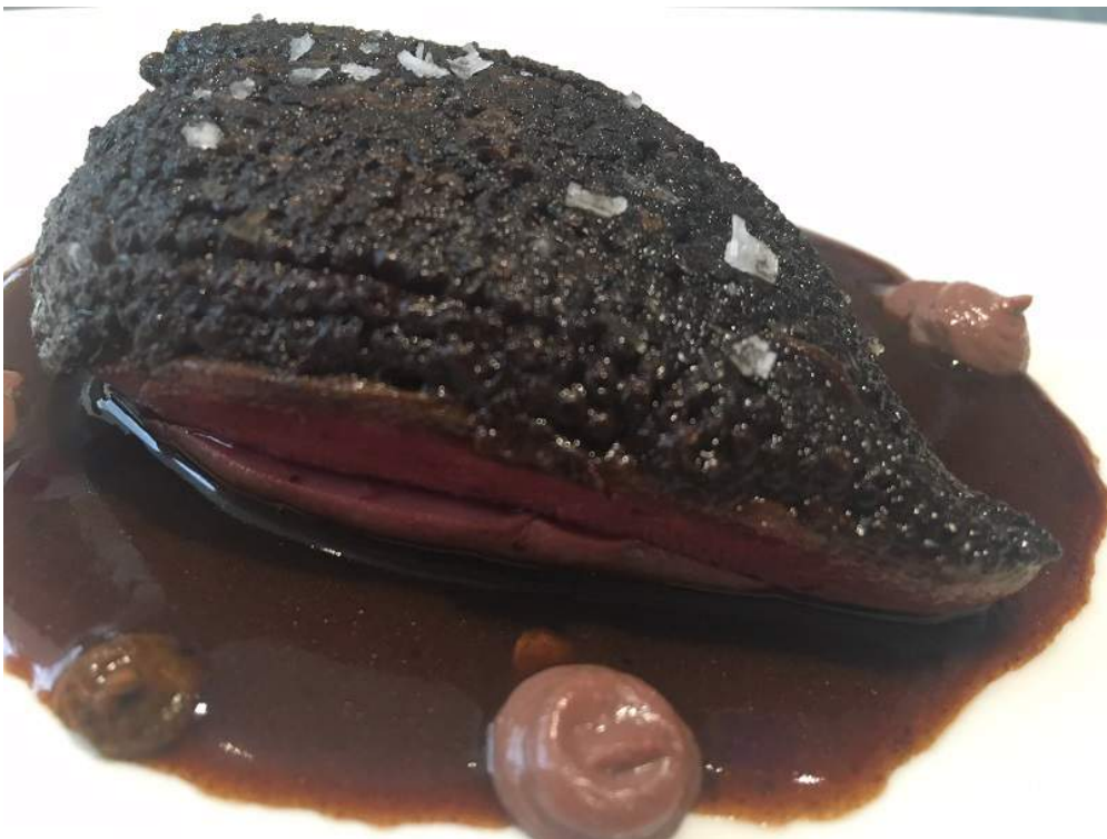
Pichón con abrigo de maíz